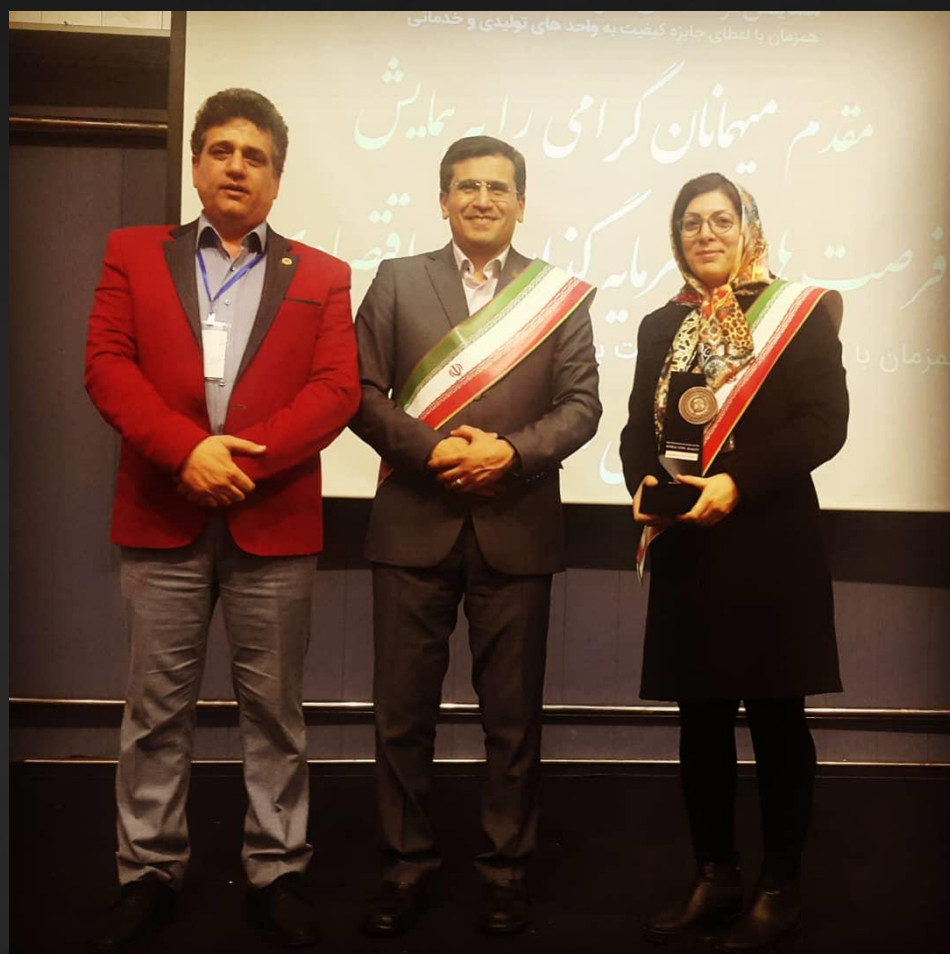
سمینار کشف فرصت های شغلی