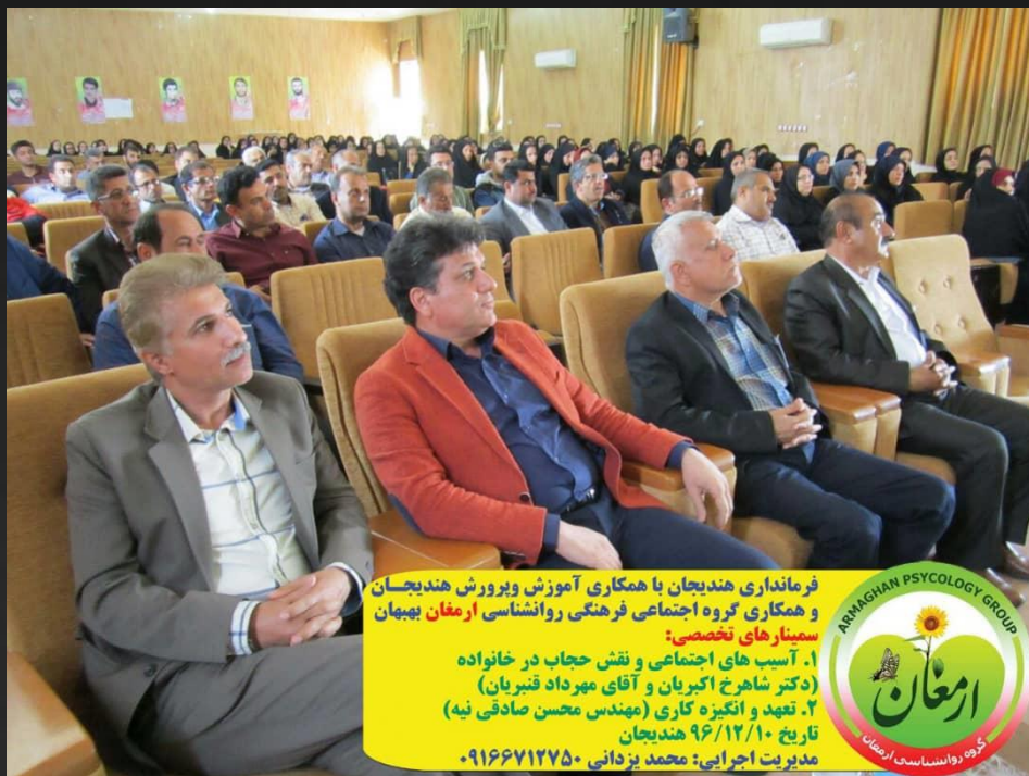
سمینار مدیریت انگیزه و تعهد کاری